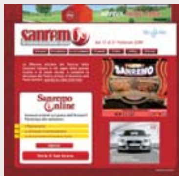
attenzione: immagini a titolo esemplificativo